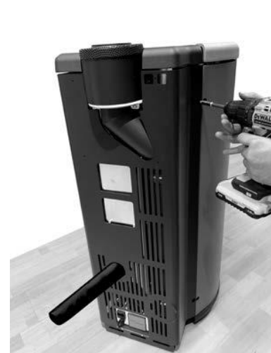
Fig. 6 - Separat luftslange