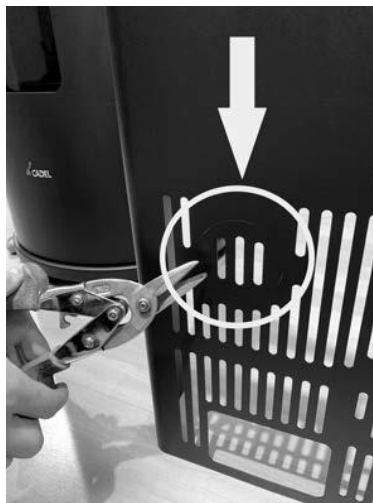
Fig. 2 - Bryd ringen