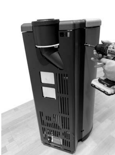
Fig. 1 - Fjern skærmen