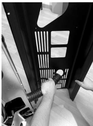
Fig. 5 - Åbning fleksibelt rør 2