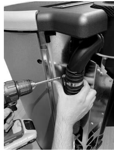
Fig. 3 - Træk det fleksible rør ud